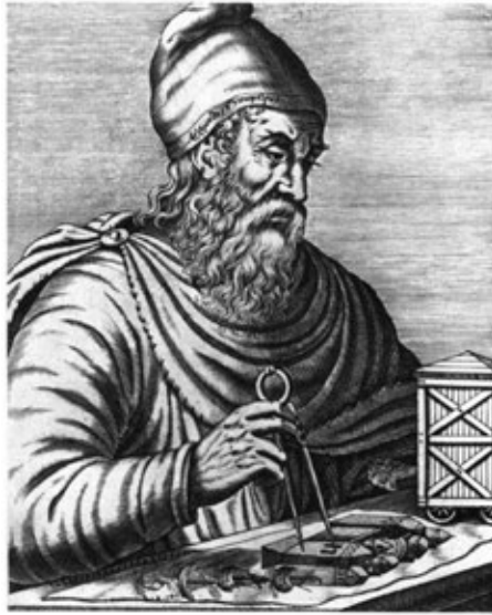
Arquímedes de Siracusa.

Nacimiento: Siracusa, Sicilia, c. 287 a. C.